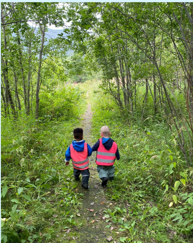
Veien blir til mens du går.