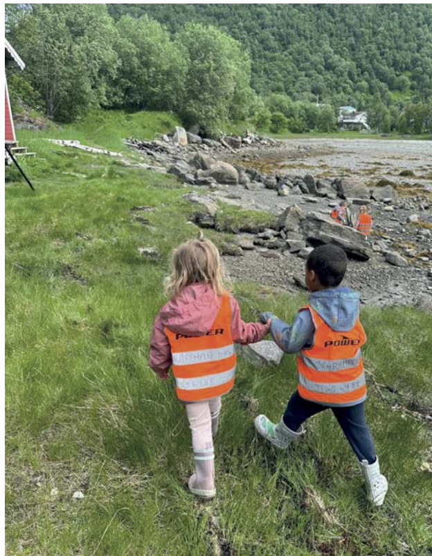
Veien blir til mens du går.